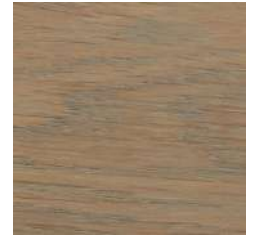
85036 Titanium Grey