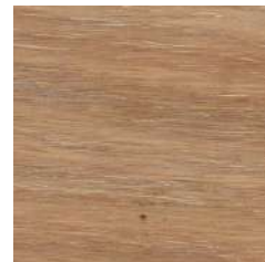
85040 White 5%