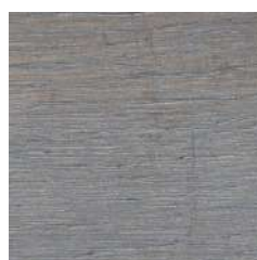
85028 Silver Grey