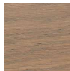
85020 Mud Light