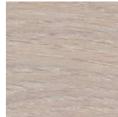
85035 Super White