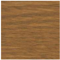
85001 Antique Bronze