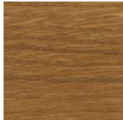
85033 Smoked Oak