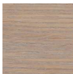
85029 Sky Grey