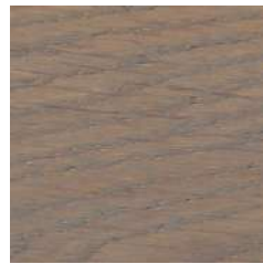
85014 Gris Beige