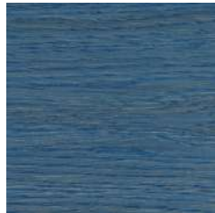
50072 Ocean Blue