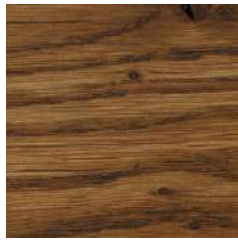
85007 Castle Brown