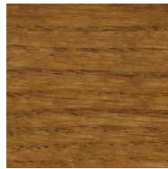
85013 Dark Oak