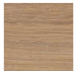
85032 Smoke 5%