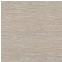
85012 Cotton White