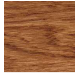
85016 Ice Brown