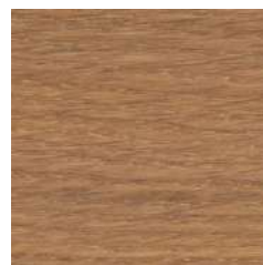
85019 Mist 5%