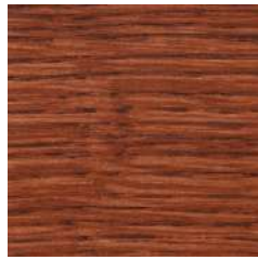
85009 Cherry Coral